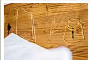
... ganz besonders kreative Träume.