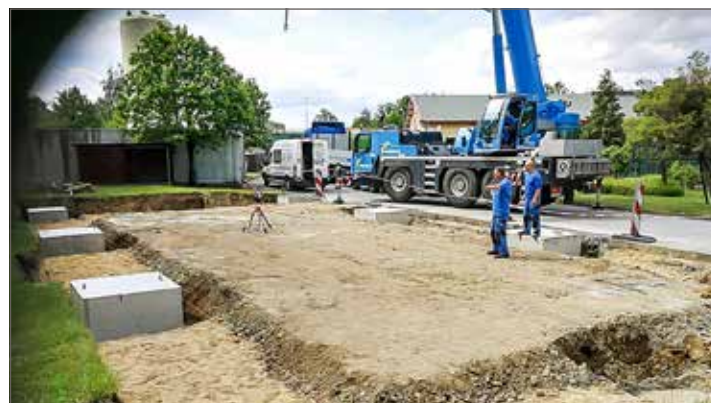
Anfang Juni: Das Fundament ist in Arbeit.

Auf 200 Quadratmetern lagern inzwischen vor allem Verpackungen, also z. B. Saftboxen und die Kunststoffbeutel, in die die Säfte der Kelterei abgefüllt werden.