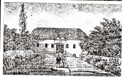
1840: Das Gesellschaftshaus war der Vorläufer der Schloßschänke.