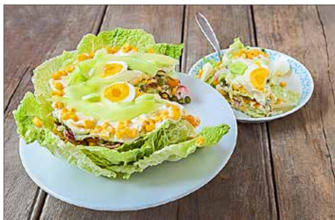
Salattorte ist ein vitaminreicher Hingucker auf dem Partybuffet oder bei einem Grillabend.

Die Form der Köstlichkeit wird z.B. durch einen runden Tortenring oder einem eckigen Backrahmen vorgegeben. Dieser wird auf einem Teller platziert. Den „Boden“ der Torte bilden beispielsweise Salatblätter und Käsescheiben. Darauf wird wiederum eine Salatsauce gestrichen. Die Sauce kann z. B. aus Crème Fraîche und Frischkäse bestehen und nach Belieben gewürzt werden. Auf die erste Schicht Salatsauce legt man dann gut abgetropft Gemüse seiner Wahl, welches wiederum mit Sauce bestrichen wird. So geht es Schicht für Schicht weiter. Zum Belegen