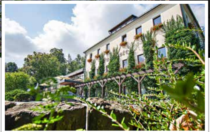
Aus den Zimmern und von der Terrasse haben die Gäste einen großartigen Blick ins Land.

Weitere Infos gibt es hier: www.burghotel-stolpen.de