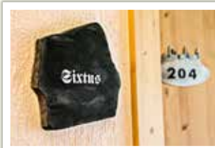
Die Zimmernamen stehen natürlich auf Basalttafeln.