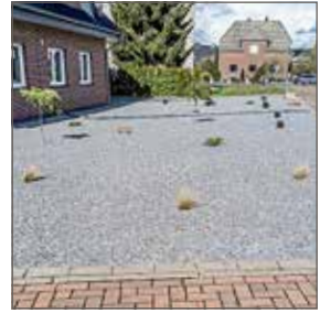
Nr. 19.1102: Hier könnte es auch blühen. Die Besitzer dieses Vorgartens scheinen zu viel Natur aber nicht zu mögen.

Mit einem Augenzwinkern versammelt eine Internet-Community um den Initiator Ulf Soltau auf Facebook und Instagram Bilder von steril wirkenden Schottergärten, den „Gärten des Grauens“. Der Name verrät schon, dass sich die Einsender der Bilder über die Ästhetik solch naturferner Gärten ziemlich einig sind. Schotterwüsten im privaten Vorgarten oder auf öffentlichen Flächen machen allerdings kaum weniger Arbeit als ein „richtiger“ Garten, denn Laub und Algen müssen mühsam ferngehalten werden.