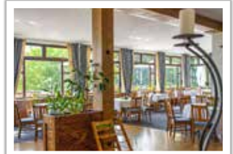
Fünf Räume mit insgesamt 180 Plätzen bieten viel Platz für Ausflügler, Familienfeiern und Tagungen.