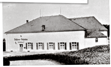
Viele Details der Schloßschänke konnten bis heute erhalten werden.