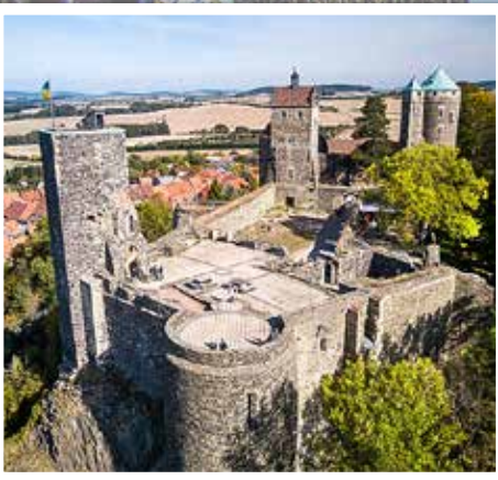
Die traumhaft schöne Burg ist immer eine Reise wert! Mindestens eine Rast sollte man im Burghotel einlegen.