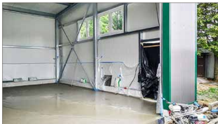
August: Die letzten Arbeiten werden durchgeführt.