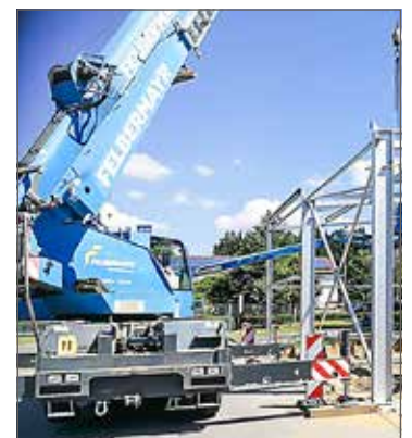
Mitte Juni: Die Stahlkonstruktion