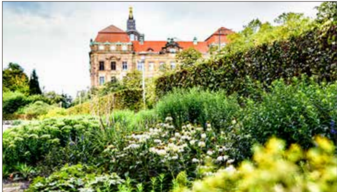
Der Staudengarten am Neustädter Elbufer in Dresden (Foto links) befindet sich in Nachbarschaft zum bekannten Rosengarten. Auch in Bad Schandau säumen Staudengewächse das Elbufer (Foto rechts).

Wer selbst keinen Platz für einen Staudengarten hat, kann sich an vielen öffentlichen Orten an den Gewächsen erfreuen. Ein solcher Staudengarten befindet sich zum Beispiel am Neustädter Elbufer unterhalb der Sächsischen Staatskanzlei in Dresden. Die unter Denkmalschutz stehende Parkanlage wurde bereits in den 1930er Jahren angelegt und 2009 rekonstruiert.