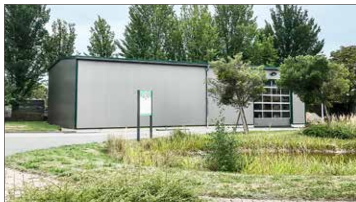
September: Fertig! Und schon wird die Halle eingeräumt.