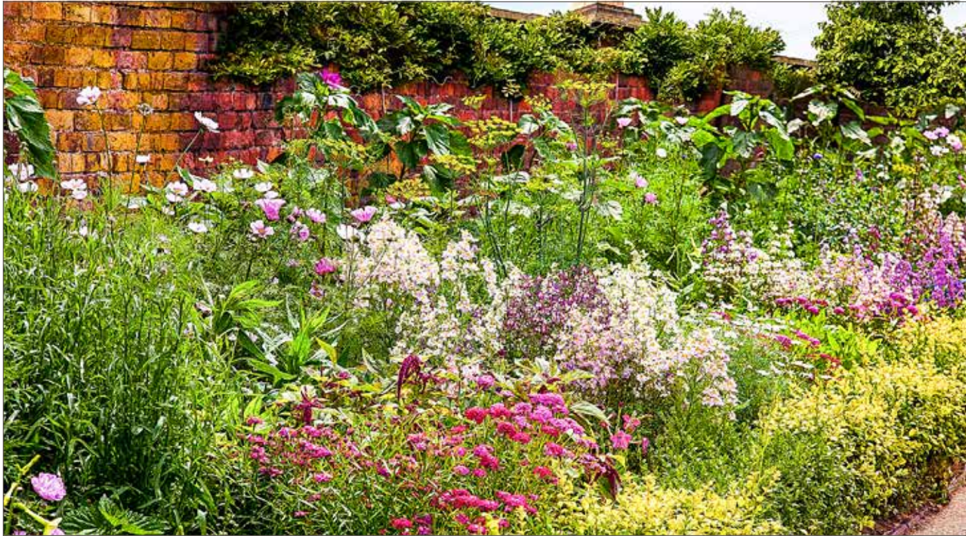
Charakteristisch für den Staudengarten ist seine Abstufung. In Richtung Beetrand werden Pflanzen mit niedrigerer Wuchshöhe eingesetzt.

Staudengärten zaubern Vielfalt in private Gärten und öffentliche Anlagen. Legt man den Staudengarten selbst an, muss man einige Hinweise beachten.