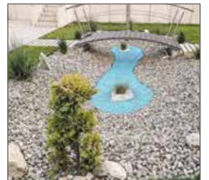
Nr. 19.1545: Auch für Nichtschwimmer geeignet ist der Teich ohne Wasser.

Ende September erscheint der satirische Blick auf die „Gärten des Grauens“ übrigens auch in Buchform (Verlag Eichborn).